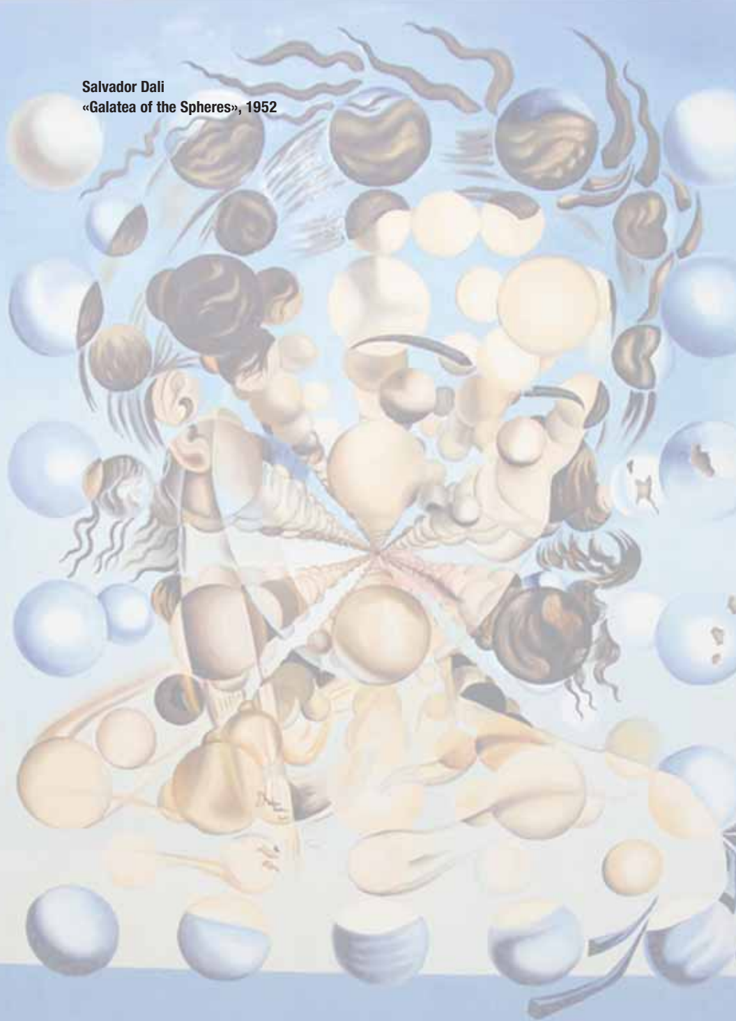
Salvador Dali «Galatea of the Spheres», 1952