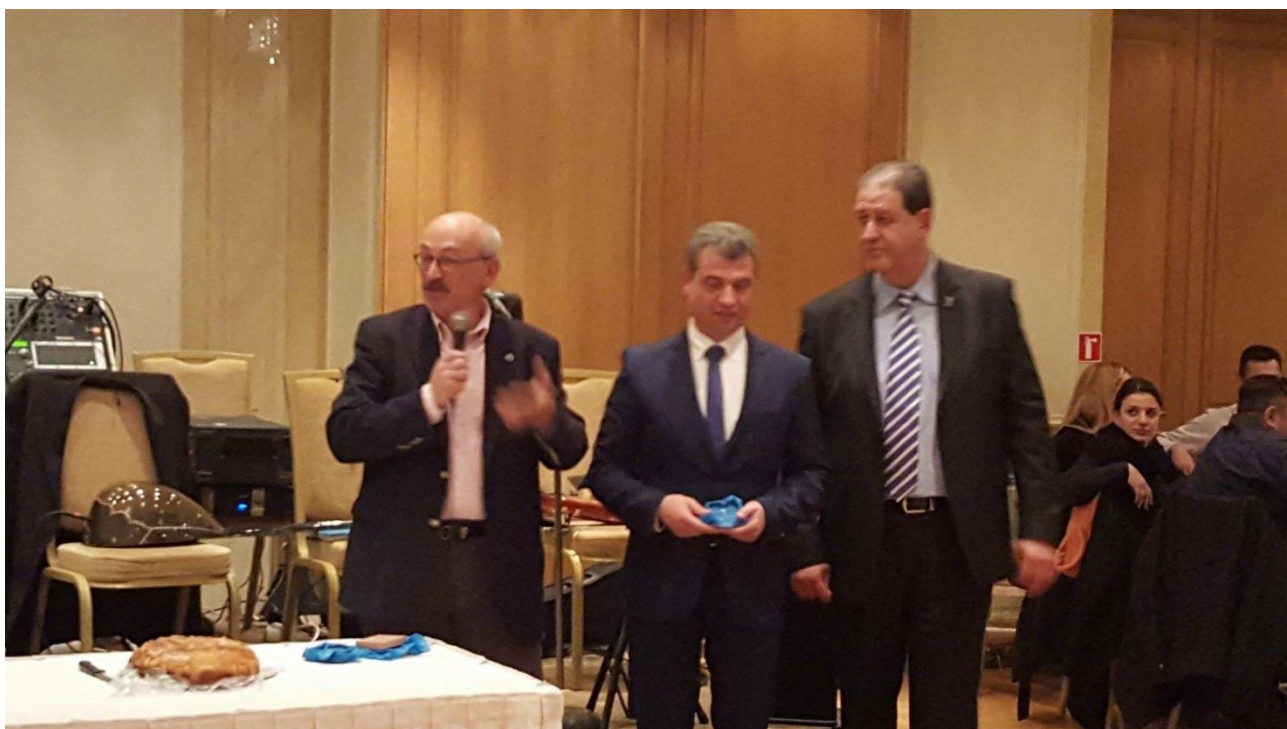
Βράβευση του Μάρκου Κωβαίου, Δημάρχου Πάρου.