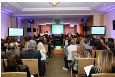
Συμμετοχή του Π.Σ.Φ. σε εκδηλώσεις