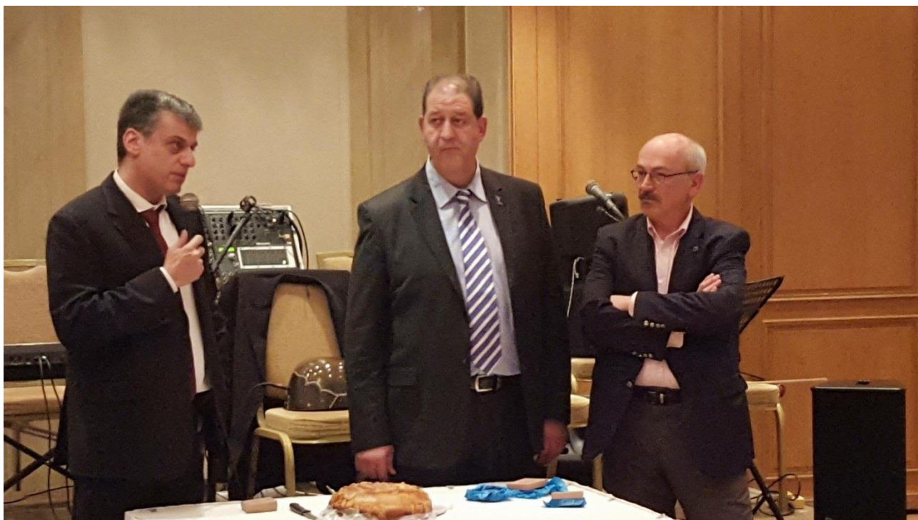
Βράβευση του Βασιλείου Μαυρίδη, Δημάρχου Ορεστιάδας.