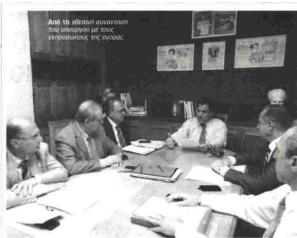
Από τη χθεσινή συνάντηση του υπουργού με τους εκπροσώπους της αγοράς

[Ξανά σήμερα] Υπουργείο, πάροχοι υγείας και γιατροί σε αδιέξοδο