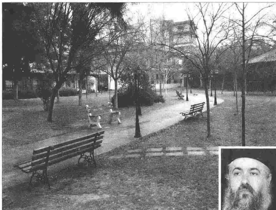
Ο αύλειος χώρος του Ιερού Ναού Αγίου Αθανασίου στον Εύοσμο, όπου θα ανεγερθεί η μονάδα φροντίδας ηλικιωμένων. Στην ένθετη φωτο, ο μητροπολίτης Νεαπόλεως και Σταυρουπόλεως κ. Βαρνάβας