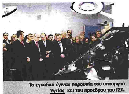
Τα εγκαινία έγιναν παρουσία του υπουργού Υγείας και του προέδρου του ΙΣΑ.