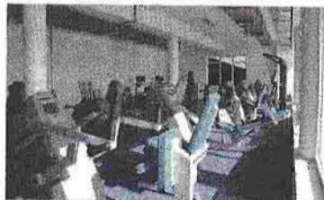
Το Κέντρο Ψυχικής Υγείας και το Κέντρο Φυσικής Ιατρικής διαθέτουν σύγχρονα μηχανήματα και άριστα ειδικευμένο προσωπικό.