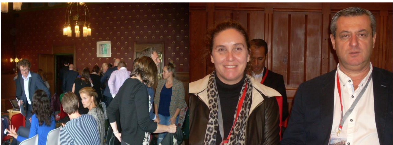
Στιγμιότυπα από την Συνέλευση

Το θέμα της Διάσκεψης ήταν η προσαρμογή, η υιοθέτηση και η εφαρμογή των υφιστάμενων κατευθυντήριων γραμμών . Στόχος, η ανάπτυξη στρατηγικών ώστε τα μέλη του ER-WCPT να επιλέξουν και να προσαρμόσουν τις υφιστάμενες κατευθυντήριες γραμμές για το τοπικό τους πλαίσιο, ώστε να ακολουθήσει η εφαρμογή τους. Το θέμα συζητήθηκε με βάση τα παραδείγματα των κατευθυντήριων γραμμών για την οστεοαρθρίτιδα και το εγκεφαλικό επεισόδιο.