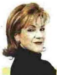
ΕΠΙΜΕΛΕΙΑ ΜΑΙΡΗ ΚΑΤΣΑΝΟΠΟΥΛΟΥ

πολλά προβλήματα υγείας) μπορεί να υποβληθεί σε αρθροσκοπική αποκατάσταση. Βέβαια, σε αυτές τις ηλικίες οι τέντοντες είναι ήδη εκφυλισμένοι και τα αποτελέσματα δεν είναι τα επιθυμητά. Γι' αυτό η ασθενής αξίζει να ξεκινήσει με φυσικοθεραπεία και αν αυτή δεν αποδώσει σε ένα μήνα τότε να σκεφτεί την επέμβαση. Η αναισθησία στην επέμβαση είναι γενική και όχι τοπική.