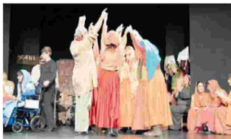
«Χριστός Γεννάται Σήμερα», η θεατρική παράσταση στην «Πόρτα Ανοιχτή» με τα παιδιά και εθελόντριες, χορό, τραγούδι, χορωδία (φωτο από εθελόντρια, 23/1/13).