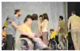
Στην υπόκλιση όλος ο θίασος χειροκροτήθηκε με ενθουσιασμό (φωτο - εθελοντική υπηρεσία, το θάλωμα της εικόνας για προστασία ατόμου).

Τα παιδιά, τα περισσότερα σε αναπηρικά καροτσάκια, άλλα υποβαταζόμενα και άλλα να περπατούν, να χορεύουν, ως και να πατινάρουν με θαυμαστή άνεση, τον περίμεναν ανυπόμονα. Είναι γι' αυτά ο Μεγάλος Φίλος που όμως ανάμεσά τους ξαναγίνεται το τρυφερό αγόρι, ο νεαρός Κρίστι Μπράουν, που με το αριστερό του πόδι έβαζε την πλάκα στο γραμμόφωνο και ανακάλυπτε τον κόσμο της μουσικής στην ταινία του πρώτου του όσκαρ! Και είχαν ετοιμάσει μία άρτια θεατρική παράσταση, με πράξεις, με ηθοποιούς, με χορούς, τραγούδια, ντίεο τα θαυμαστά παιδιά της «Πόρτας Ανοιχτής», μαζί με τις δασκάλες, τους φυσιοθεραπευτές, τις εθελόντριες που τα φροντίζουν καθημερινά, ολοκρονίς, και τους ανοίγουν πόρτες στη ζωή, στην εκπαίδευση και σε μια ενπλικίωση με χαρές παρά τις δυσκολίες!