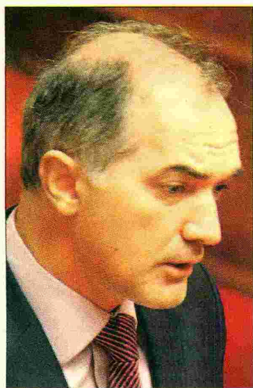
▲ Ο αναπληρωτής υπουργός Υγείας Μάριος Σαλμάς

ΑΙΣΙΟΔΟΞΟ μήνυμα για το μέλλον του ΕΟΠΥΥ έστειλε χθες από τη Βουλή ο αναπληρωτής υπουργός Υγείας Μάριος Σαλμάς, διαβεβαιώνοντας ότι σε έναν χρόνο όσα περνάει σήμερα ο Οργανισμός θα μοιάζουν κακή ανάμνηση.