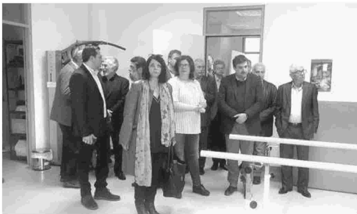
Φωτό από πρόσφατη επίσκεψη του υπουργού Υγείας στο Κέντρο Φυσικής και Ιατρικής Αποκατάστασης Ρεθύμνου

«Το ΚΕΦΙΑΠ πλέον λειτουργεί κανονικά και εξυπηρετεί μηνιαίως ένα σημαντικό αριθμό ασθενών. Μας έλειπε η ειδικότητα του εργοθεραπευ-