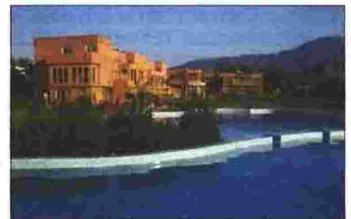
«ORPHEAS RESORT» - Χανιά: 1 θέση για ένα άτομο στο μπαρ. Βιογραφικά στην ηλεκτρονική διεύθυνση: info@orpheas-resort.gr .