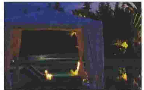
«HYATT REGENCY» - Θεσσαλονίκη: 6 θέσεις για σερβιτόρους και βοηθούς σερβιτόρων. Βιογραφικά στο: career.hrthessaloniki@hyatt.com .