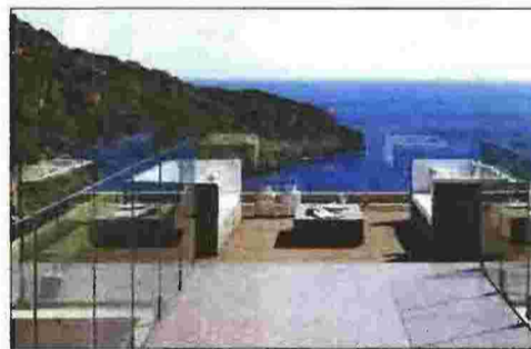
DAIOS COVE - Άγιος Νικόλαος: 2 θέσεις για night editor και ένα άτομο για δημόσιες σχέσεις. Βιογραφικά: hr@daioscove.com .