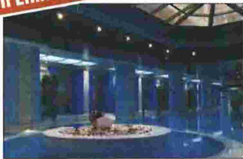
AEGEO SPAS - Κρήτη: 30 θέσεις για αισθητικούς και φυσιοθεραπευτές. Τηλέφωνο: 2810263700. Βιογραφικά στην ηλεκτρονική διεύθυνση: manager@aegeospas.gr .