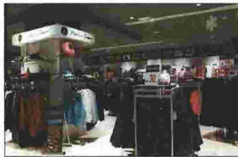
DIETHNIS ATHLITIKI - Κιάτο: 1 θέση για έναν πωλητή-τρια. Απαιτείται προϋπηρεσία σε λιανικές πωλήσεις. Fax: 2103801595.