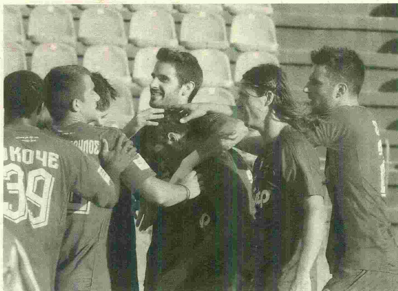
Αύριο θα προπονηθούν τελικά οι παίκτες του Πανιωνίου.

ΟΙ ΥΠΑΛΛΗΛΟΙ ΤΟΥ ΠΑΝΙΩΝΙΟΥ ΑΠΟΦΑΣΙΣΑΝ ΑΠΟΧΗ, Η ΔΙΟΙΚΗΣΗ ΠΡΟΣΠΑΘΗΣΕ ΝΑ ΤΑ ΜΠΑΛΩΣΕΙ ΚΑΙ ΤΕΛΙΚΑ Η ΠΡΟΠΟΝΗΣΗ ΘΑ ΓΙΝΕΙ... ΑΥΡΙΟ