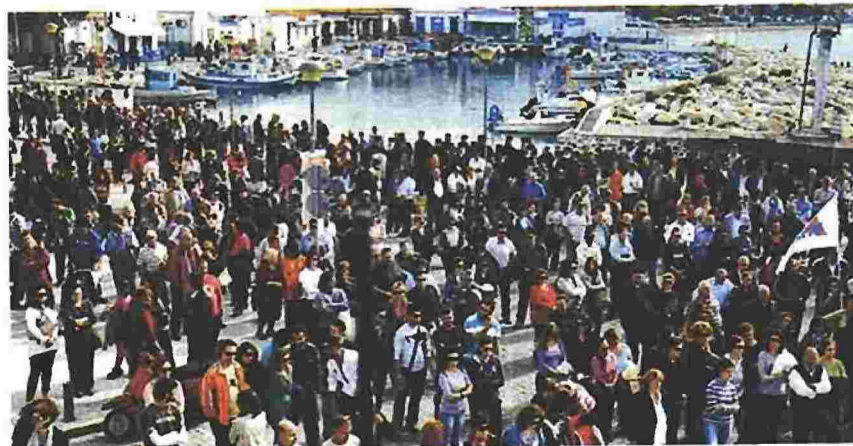
Κάτοικοι της Λήμνου διαμαρτύρονται στο λιμάνι