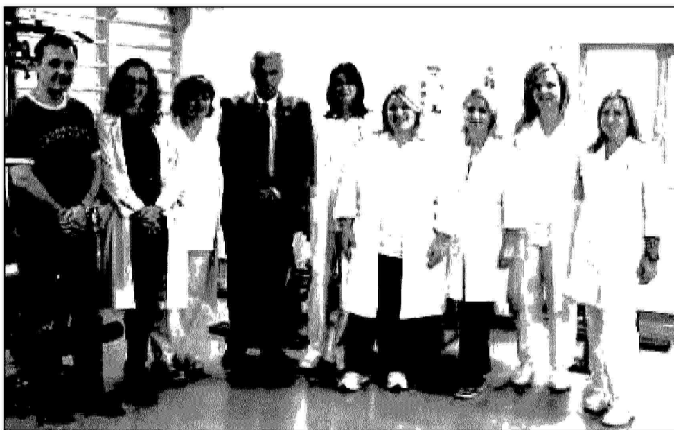
Το ιατρικό και νοσηλευτικό δυναμικό του προγράμματος

Βέβαια ο κ. Γουργουλιάνης, επισημαίνει πάνω σε αυτό, ότι σε καιρούς κρίσης, η ιστορία αποδεικνύει ότι γίνονται πολλές ανατροπές και πιθανόν μια τόσο επιστροφής στην παλαιά αντίληψη, με ό,τι συνεπάγεται αυτό για τους ασθενείς καπνιστές, είναι πιθανή, από νέες πολιτικές υγείας που θα εφαρμόσει το κράτος.