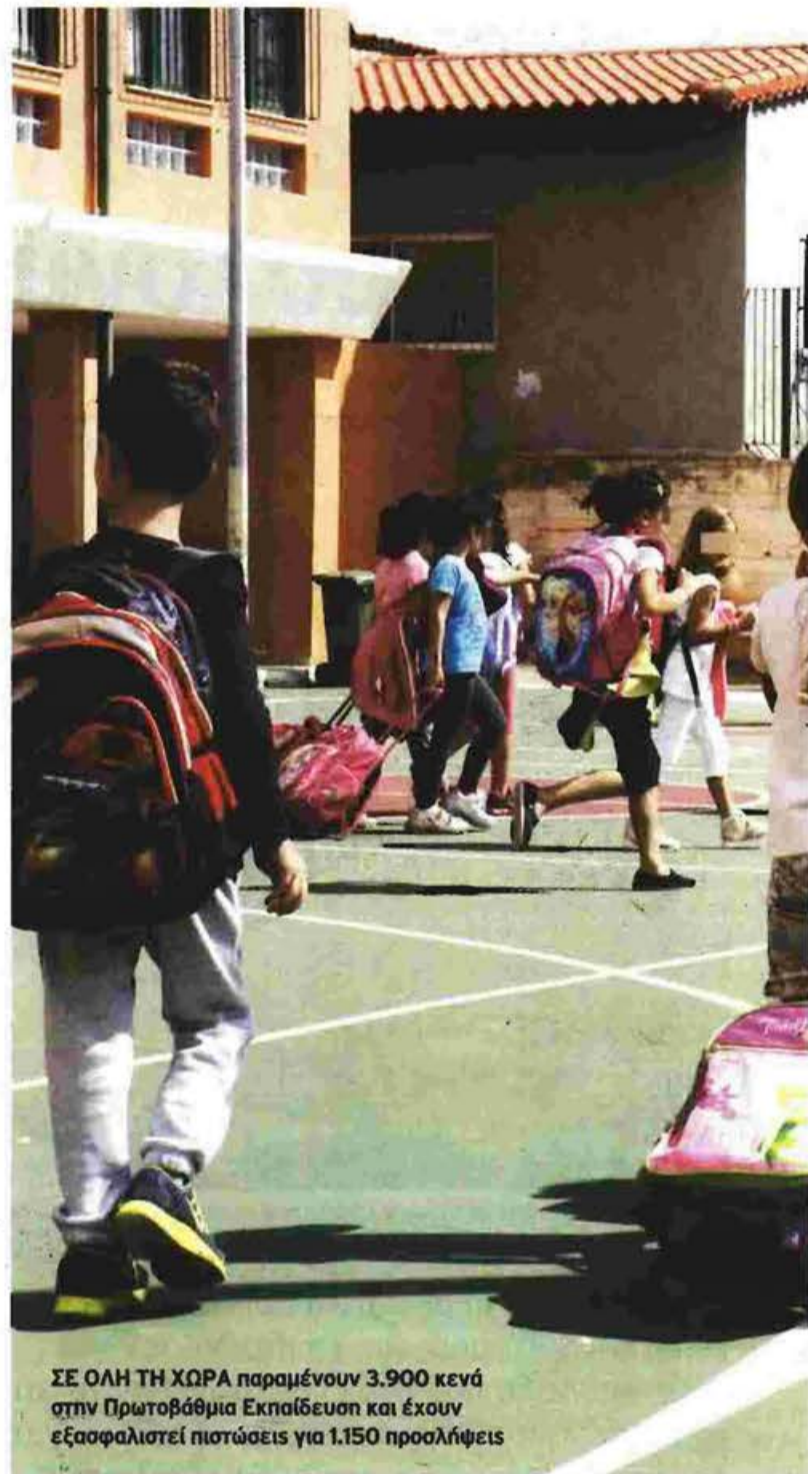
ΣΕ ΟΛΗ ΤΗ ΧΩΡΑ παραμένουν 3.900 κενά στην Πρωτοβάθμια Εκπαίδευση και έχουν εξασφαλιστεί πιστώσεις για 1.150 προσλήψεις

Την Παρασκευή, σύμφωνα με τον κ. Τουλγαρίδη, ανακοινώθηκαν μόνο 25 προσλήψεις ειδικοτήτων. «Οι διορισμοί που ανακοίνωσε το υπουργείο Παιδείας αποκαλύπτουν πια ότι συστηματικά προσανατολιζόμαστε να καλύψει μόνο ένα μέρος των πρωινών κενών και να συρρικνώσει ή σε πολλές περιπτώσεις να καταργήσει τα ολοήμερα. Αυτό επιβεβαιώνεται και από την πρόσφατη εγκύκλιο του υπουργού, ο οποίος ανοίγει το ζήτημα για την παρακολούθηση του ολοήμερου από τα παιδιά των οποίων και οι δύο γονείς εργάζονται».