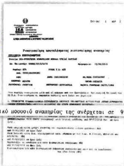
το συνολικό ποσοστό αναπηρίας της ανέρχεται σε 99% (αριθμ.)

Δυστυχώς για εκείνη, πριν από μερικές ημέρες βρέθηκε μπροστά στην κλωστοεργία της ελληνικής γραφειοκρατίας. Για του λόγου το αληθές, ανακάλυψε πως η Ασπασία δεν μπορεί να πάρει το επίδομα, παρά μόνο