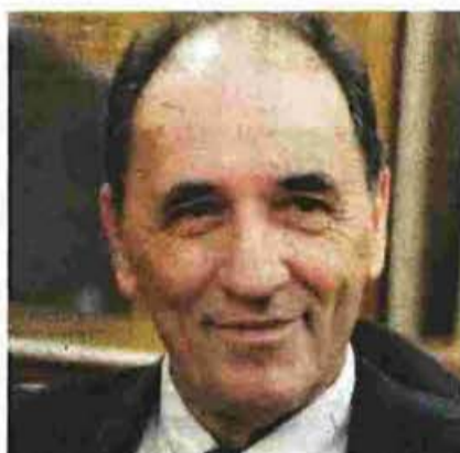
Αριστερά: Ο υπουργός Οικονομίας Γιώργος Σταθάκης. Δεξιά: Ο υφυπουργός Οικονομίας, αρμόδιος για θέματα ΕΣΠΑ, Αλέξης Χαρίτσος.

Τέσσερα νέα προγράμματα για πτυχιούχους, άνεργους, ελεύθερους επαγγελματίες και τουριστικές επιχειρήσεις προωθεί το υπουργείο Οικονομίας, Ανάπτυξης και Τουρισμού, με στόχο την επανεκκίνηση της οικονομίας και τη δημιουργία νέων θέσεων εργασίας. Οι δράσεις αυτές χρηματοδοτούνται από το ΕΣΠΑ της περιόδου 2014-2020, έχουν προϋπολογισμό 350 εκατομμύρια ευρώ και προβλέπουν επιδότηση ακόμη και 100% , για την έναρξη νέων αλλά και την αναβάθμιση υφιστάμενων επιχειρήσεων.