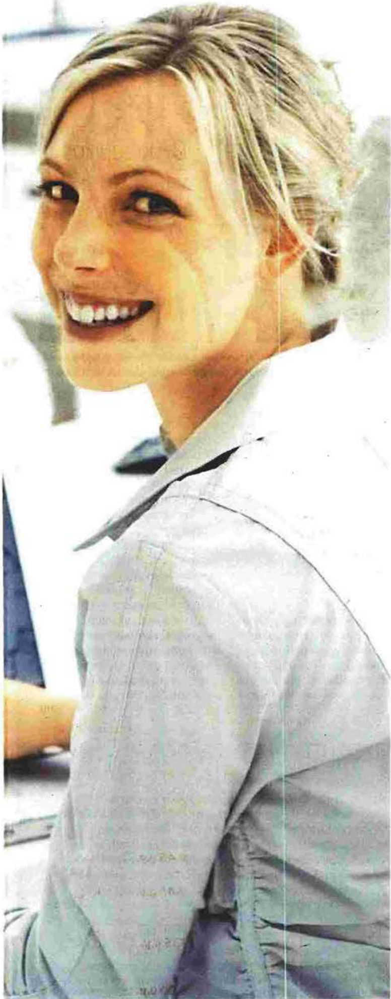
Τα δύο νέα προγράμματα του ΕΣΠΑ χρηματοδοτούν από 5.000 έως 60.000 ευρώ με κοινοτικές ενισχύσεις τα λειτουργικά έξοδα, την αγορά εξοπλισμού και την πρόσληψη προσωπικού