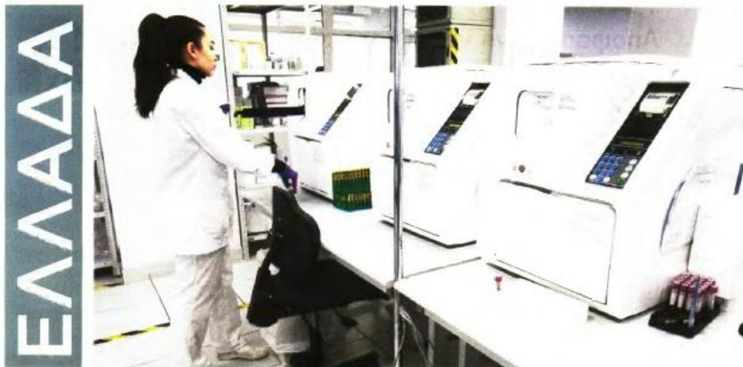
ΤΡΙΗΜΕΡΗ ΚΙΝΗΤΟΠΟΙΗΣΗ ΑΠΟ ΤΑ ΙΔΙΩΤΙΚΑ ΔΙΑΓΝΩΣΤΙΚΑ ΚΕΝΤΡΑ ΚΑΙ ΕΡΓΑΣΤΗΡΙΑ