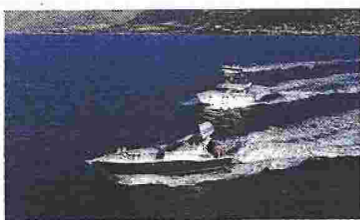
Κλιμάκιο 38 εθελοντών του Ομίλου ΥΓΕΙΑ ταξίδεψε σε Αγαθονήσι και Λειψούς.

ΔΩΡΕΑΝ ΥΠΗΡΕΣΙΕΣ υγείας και φαρμακευτικό υλικό στους κατοίκους των νησιών Αγαθονήσι, Λειψοί, Φούρνοι προσέφερε το νοσοκομείο ΥΓΕΙΑ, στο πλαίσιο της προγράμματος «Ταξιδεύουμε για την Υγεία».