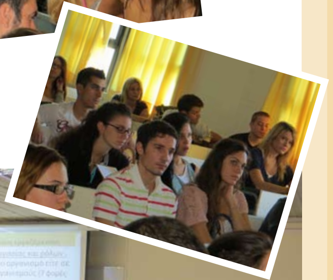
Ημερίδα «Πρακτική άσκηση φοιτητών του τμήματος Διοίκησης Επιχειρήσεων»